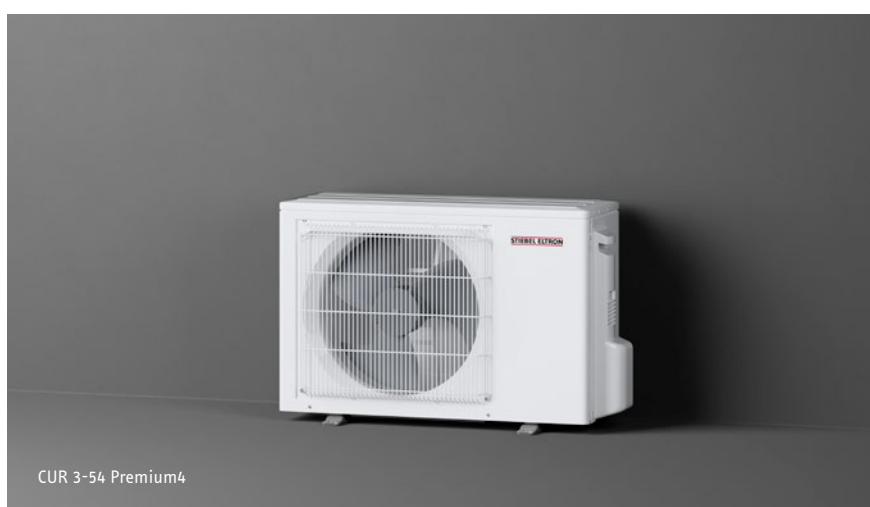
CUR 3-54 Premium4

Installations-Raumklimagerät CUR Premium4